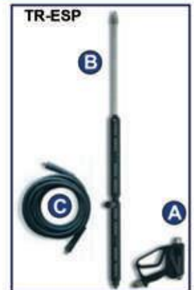
A Pistola B Lanza C Manguera A.P.

OPCIONAL: Enrollador MT 5006 Enrollador Metálico para 100 mts. Manguera de 1/2 "